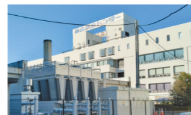
サンフェスタ空調更新工事で新しく設置された熱源ヒートポンプチラー