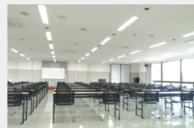
卸町会館内に新しく設置された空調設備(4階大会議室)

第696回理事会で承認された、地域共同暖房停止および熱源システムの更新に伴う卸町会館空調更新工事は、1期工事(2階歯科医院内・8/8～8/15)2期工事(1階:中会議室/郵便局内・4階:エントランスホール、第一会議室、第二会議室、中ホール、大会議室、特別会議室8/26～10/31)を実施し、全ての工事が10月31日に完了しました。