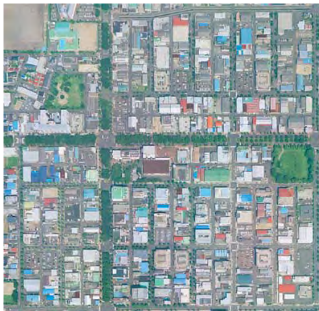
緑のケヤキに沿った十字のエリアが今回の地区計画エリアで通称「十字ゾーン」地区計画区域です。

主な内容は、商業施設について 駐車場について けやき並木に面する共同住宅の配置について 街並みの連続性について 壁面後退用地の利用について 屋外広告物について 美観について などです。詳細は、ガイドライン関連資料をご覧ください。